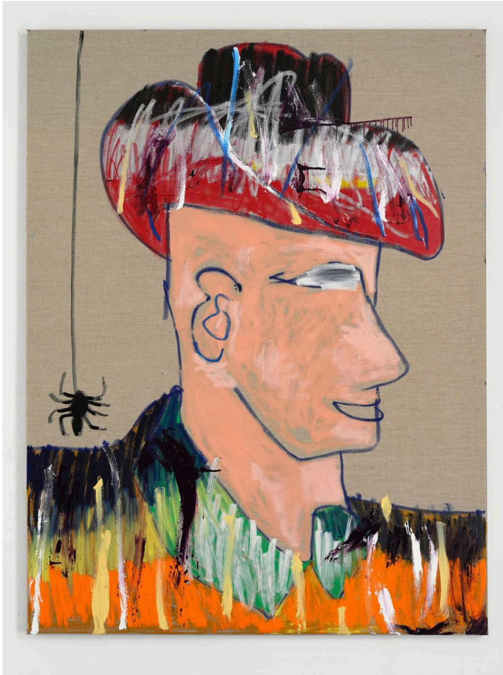
"Ernest Tubb" 170 x 130 cm oil and oil stick on canvas 2024 9000 Euro