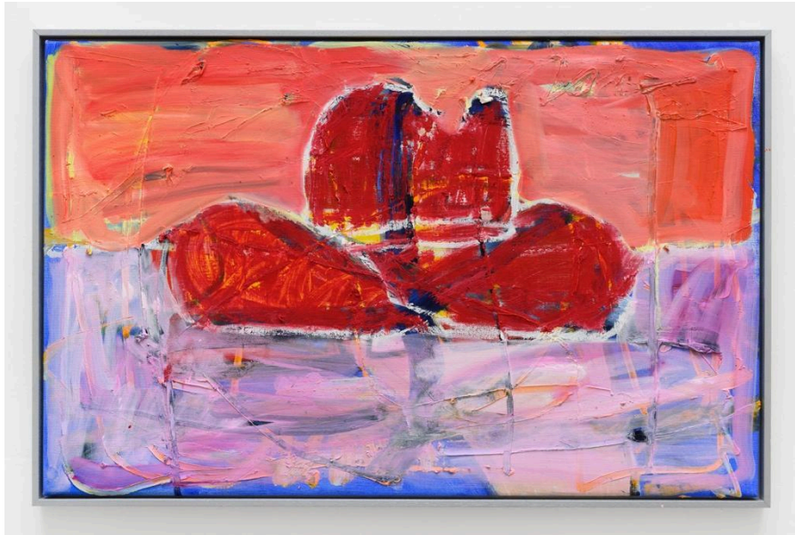
"Cowboy hat" 107,5x 67,5 cm 2023 oil and oil stick on canvas 5250 Euro